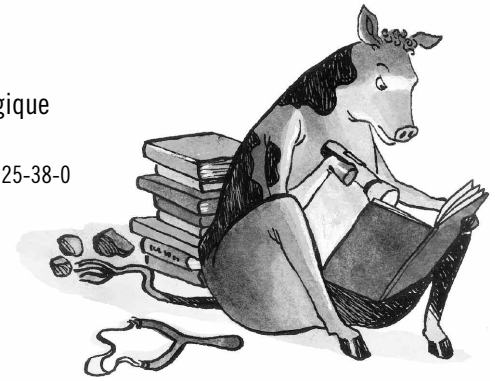
ILLUSTRATION : CAROLINE MEROLA

Personnage principal : il n'a pas de nom Personnages secondaire : Guillaume Vocabulaire : usuel, courant Moyenne de huit à dix mots par phrase