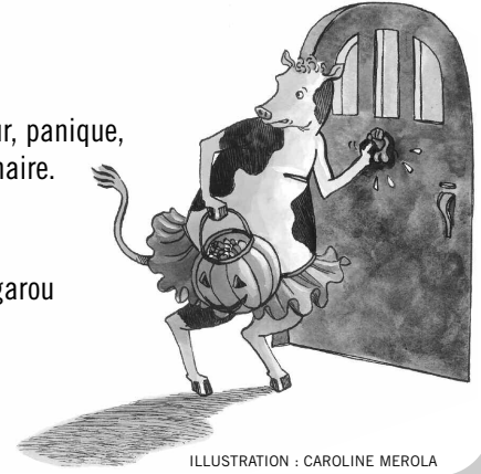
ILLUSTRATION : CAROLINE MEROLA

Moyenne de douze à quinze mots par phrase