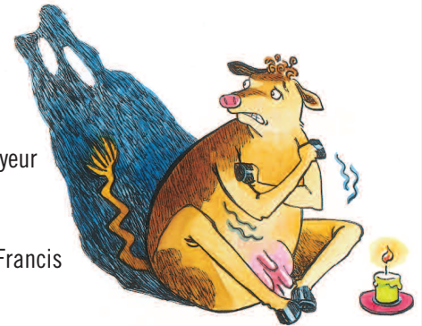
ILLUSTRATION : CAROLINE MEROLA