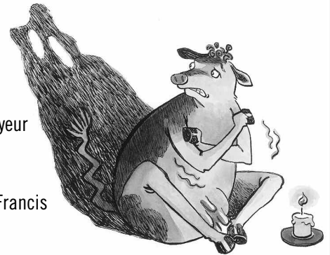
ILLUSTRATION : CAROLINE MEROLA