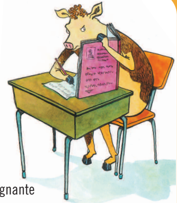
ILLUSTRATION : CAROLINE MEROLA