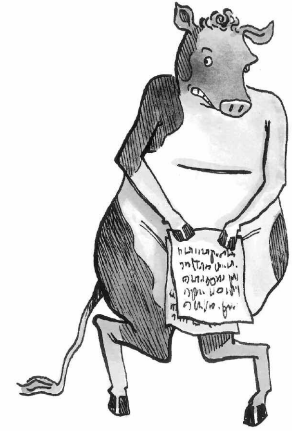
ILLUSTRATION : CAROLINE MEROLA